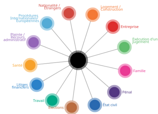
Figure 1: Le portail d'accès au droit justice.fr